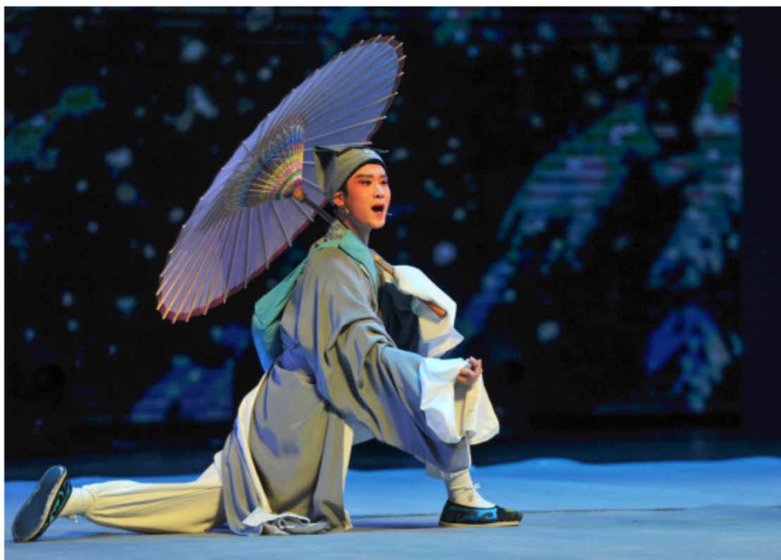
图片 10: 锡剧《珍珠塔-跌雪》参加第四届“梨花杯”全国青少年戏曲教育教学成果展演。