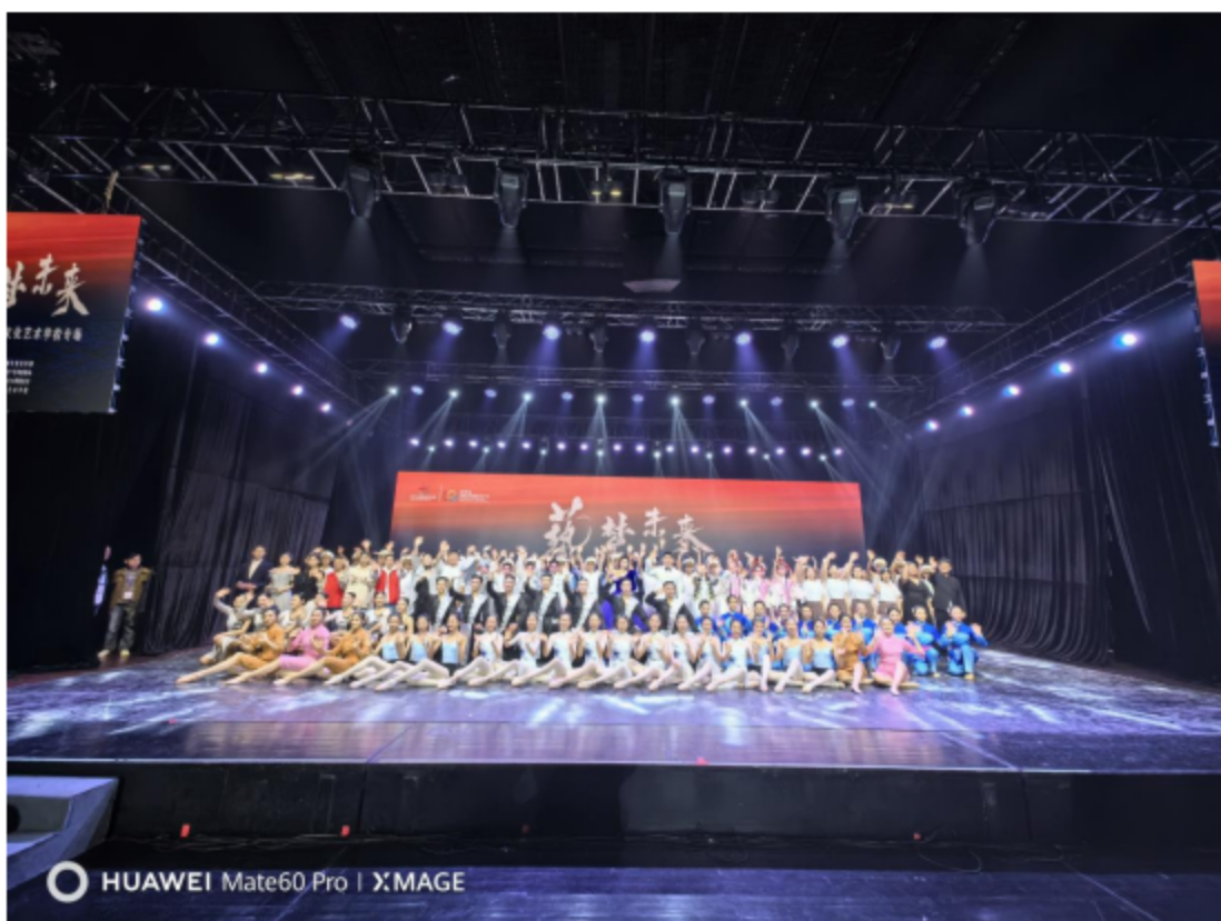
图片 2：上海国际艺术节无锡分会场“艺梦未来”无锡文化艺术学校专场演出。