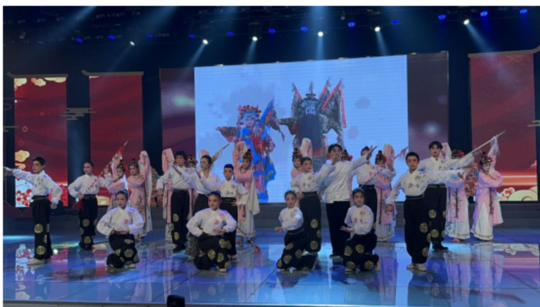
图片 3：锡剧专业学生《一脉传承》参加无锡教育电视台校园春晚录制。