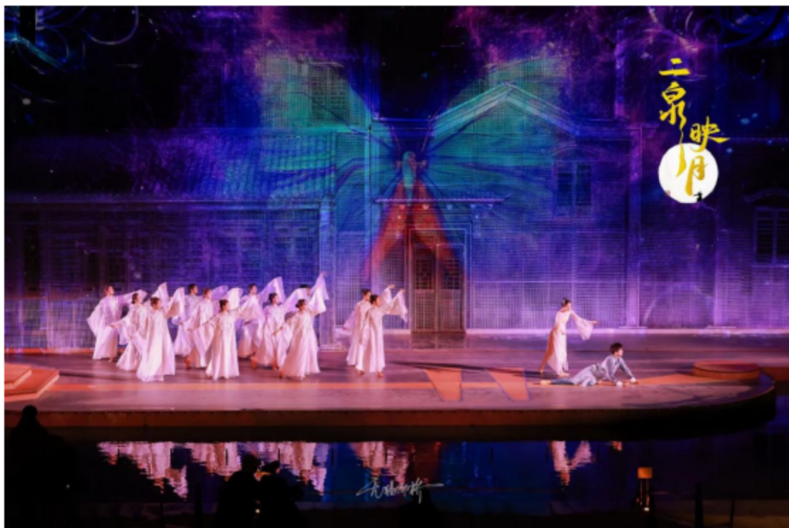
图片 4: 舞蹈专业学生受邀参加无锡市歌舞剧院原创芭蕾舞剧《二泉》演出活动。

艺术职业教育的特色凸显，专业发展定位由单一考学向“升学+就业+考学”转变，根据“职业成长规律”和“工作过程系统化”的思路，架构本专业课程体系，采用“必修与选修相结合”的形式，开展分段、分层、分类教学，满足不同专业学生的成长需要。完成专业升级，在“院团合一、学演结合”的人才培养模式统领下，建成适应专业发展需要的高水平示范省内一流的舞蹈表演综合实践实训中心。1+X证书制度全面实施，形成多样化人才培养模式，信息化建设成为专业改革的重要支撑，专业由规模发展向质量提升内涵发展的方向转变。