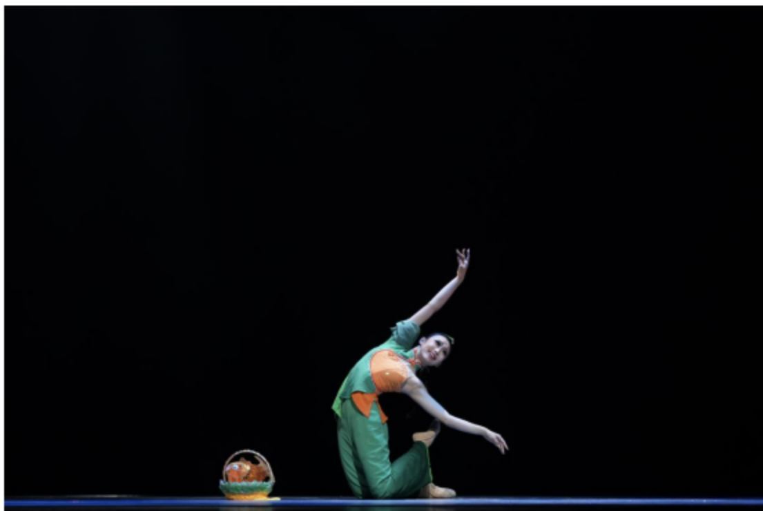
图片 7: 原创舞蹈《渔篮吟》获江苏文艺大奖·第八届舞蹈奖铜奖。

坚持“以就业为导向、素质为核心、能力为本位”的价值取向，纵向贯通、横向融通，校企联通，适应文化产业和文艺事业对不同层次艺术人才的需求，让学生就业有能力、升学有优势、发展有通道。坚持“大艺术”理念，使本专业与其他文化艺术类专业适度交叉，鼓励学生在学好本专业的前提下，选修其他专业的理论和实训课程，培养一专多能的复合型人才，使学生具有宽广的综合适应能力，学生专业精神、职业精神和工匠精神得到有效培养，专业文化实力增强。