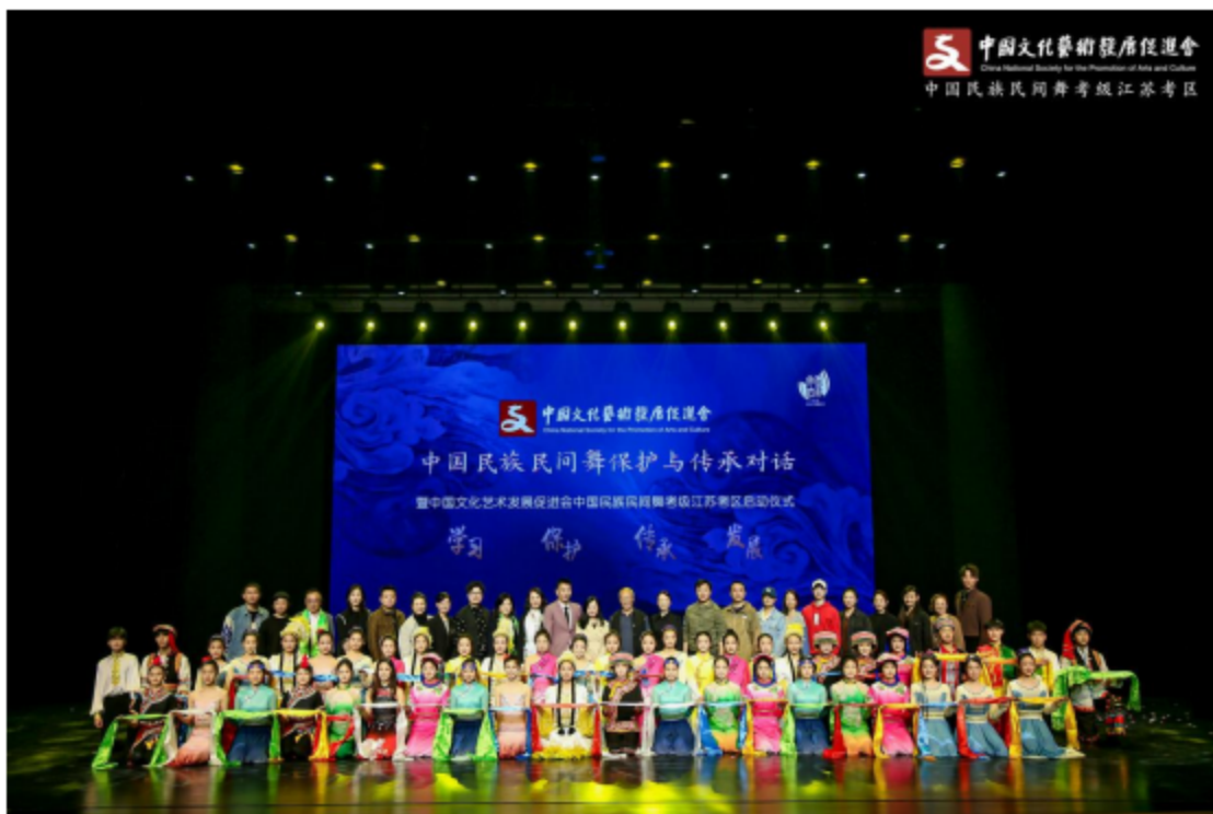
图片 1: 中国文化艺术发展促进会主办、学校承办中国民族民间舞保护和传承对话活动。

学校专业秉持“修德治艺，崇文笃行”校训，按照“围绕舞台、传承文化、服务社会”的办学宗旨，育训结合，对接产业，服务行业，提质培优，发挥舞蹈表演专业建设的引领促进作用。瞄准文化产业市场，培养德艺双馨艺术人才；弘扬地方特色文化，担当传统艺术传承人培养重任；推动产教有效融通，创建“校团一体，学演结合”的艺术教育新模式；服务地方文化建设，打造无锡文化艺术闪亮品牌。