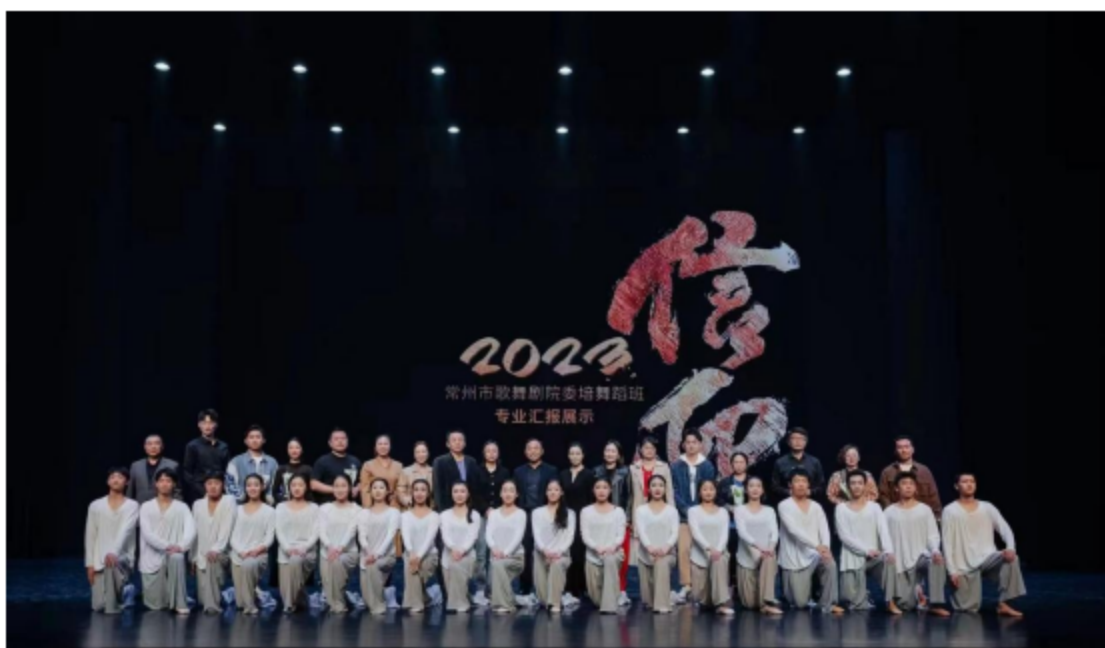
图片 6: 学校和院团领导观摩 2023 年常州市歌舞剧院委培班专业汇报。