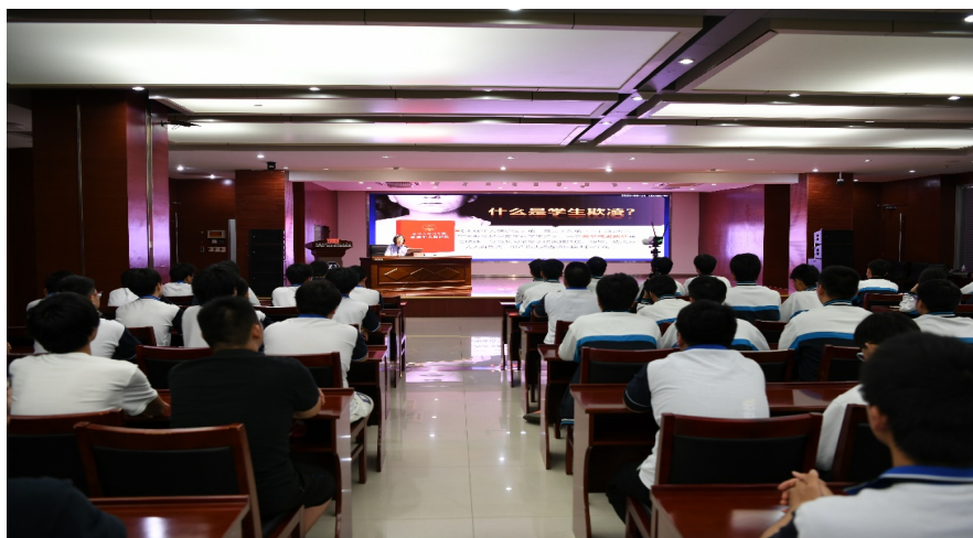
图 2. 学校法治副校长、检察院检察官来校开展法治教育讲座