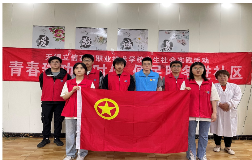
图 19. 学校师生进社区开展便民服务