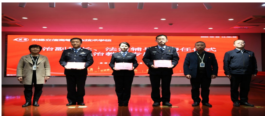
图 1. 学校聘任无锡监狱民警为学校法治副校长、法治辅导员

的开展“珍爱生命，远离毒品”、“国防知识讲座”、“争做宪法小卫士”、“防范校园欺凌”、“防范电信网络诈骗”等不同主题的法治宣传教育活动。二是案例教育，组织学生线上线下学习无锡市中级人民法院编制的《无锡市青少年法治宣传漫画案例读本》，参与“连线法官”专栏，树立有困惑找法官的意识。三是联动教育，利用立信大讲堂，邀请司法机关人员来校进行法律知识宣讲。本年度，学校先后与地方派出所、无锡市中级人民法院、江苏省无锡监狱、梁溪区人民检察院开展合作，聘任监狱民警、检察官等担任法治副校长或法治辅导员，充实学校法治教育专兼职教师队伍。四是体验教育。组织学生和家长参观法庭和戒毒所，了解法律相关知识，亲身体验法律的威严。