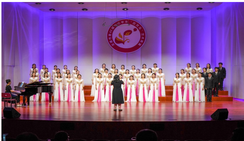
图 9. 学校繁星合唱社参加无锡市“百灵鸟”比赛获银奖

学校已建立 17 个校外社会德育活动实践基地，构建协同育人网络。学校现共有五大类社团 39 个，每周四下午固定为社团活动时间，学生参与社团覆盖率达 100%。啦啦操社团荣获全国青少年啦啦操无锡站集体自选动作冠军、在第五届中国啦啦操文化纪获得全国啦啦操二星级俱乐部称号。繁星合唱社团演唱的《这世界那么多人》和《我心歌唱》两首作品，荣获无锡市第 42 届中小学生“百灵鸟”艺术展演银奖。多个学生社团的表演在藕塘职教园区首届社区艺术节上获奖。