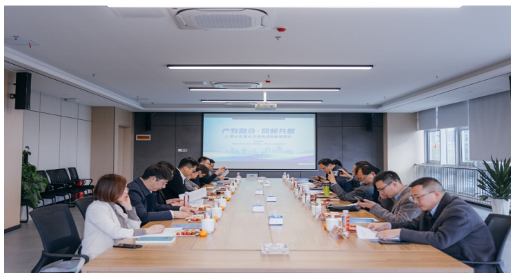
图 10. 学校领导与惠山循环经济产业园参观交流

本次访企拓岗活动也是深化校企合作的一次重要举措，有利于对企业人才需求的了解，拓展了就业渠道，增加了就业岗位，提高了就业质量，促进了职业教育与就业和企业人才需求的有效对接，对进一步提高职业教育的人才培养质量和就业质量，能更好地服务地方经济，实现“鲲鹏迭变”。本次活动由江苏联合职业技术学院学校招就处副处长华骏主持，惠山人才集团总经理也介绍了与学校共同探索人才培养的工作思路，马校长与企业在校企合作、人才培养、学生职业规划、企业发展需求、学生实习实训、就业需求等方面达成了广泛意向。