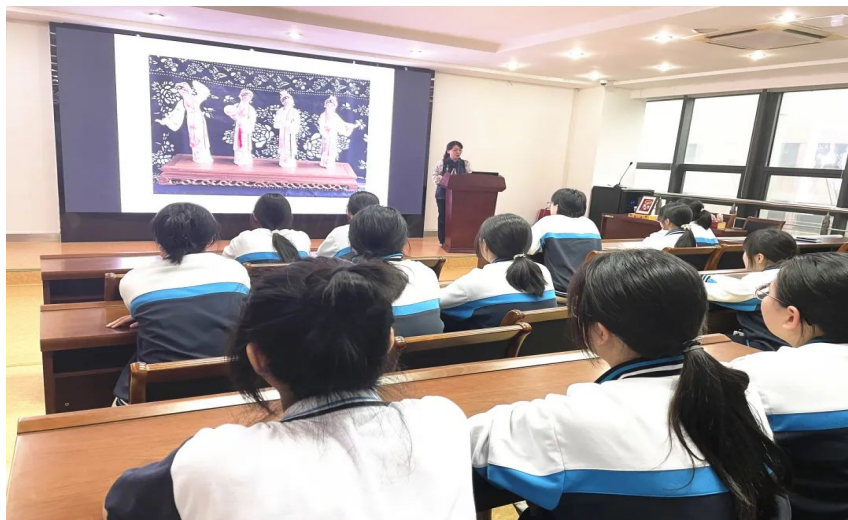
图 18. 学校邀请“江苏省五一劳动奖章获得者、惠山泥人传承人”做讲座