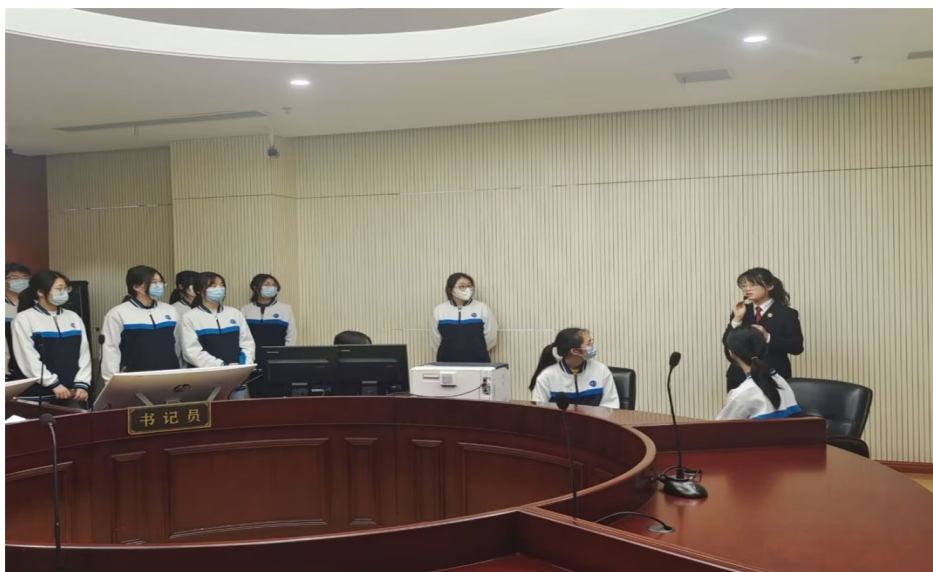
图 4. 学校学生参观体验无锡市中级人民法院法治教育实践基地