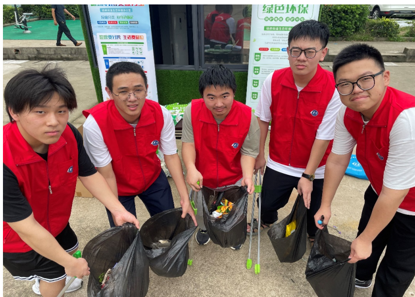
图 20. 学校实践团参与当地环境保护志愿服务工作

社会主义核心价值体系和时代精神、劳动工匠精神的构建，为全面推进美丽中国建设贡献力量。