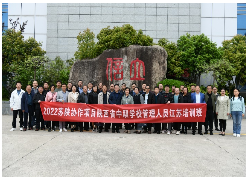
图 14. 学校 2022 苏陕协作陕西省中职学校管理人员培训班学员合影

通过三天交流，陕西省中职学校管理人员深入了解学校的学校管理、专业发展和教育教学基本情况，促进了陕西和江苏两地中职校之间的沟通与交流，激发了职业教育发展新动能，适当助力陕西地区打造一支职业教育管理的骨干力量，从而引领带动当地职业教育发展。