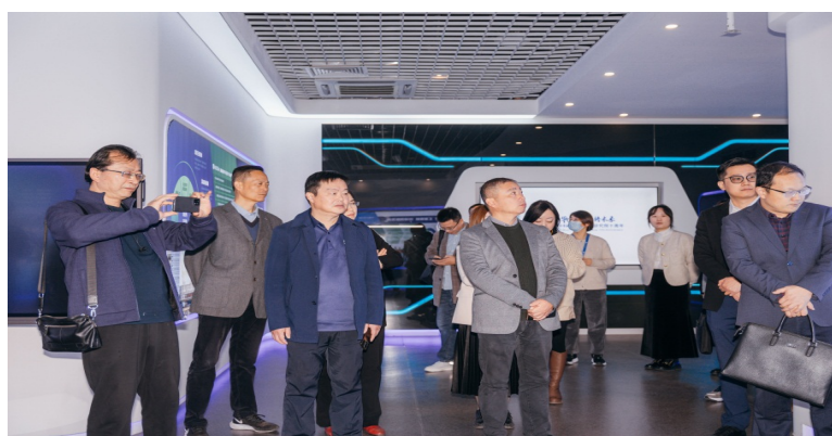
图 12. 学校领导与华中科技大学无锡研究院参观交流