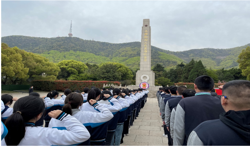
图 21. 学校组织学生清明节到烈士陵园祭扫革命烈士