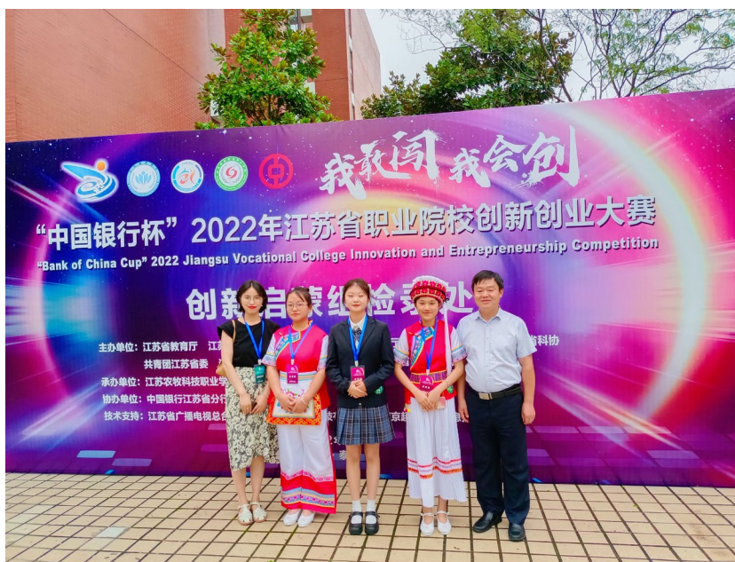
图 6. “中国银行杯” 2022 年江苏省职业院校创新创业大赛获奖

不同专业的中专学生组成的创业团队。团队拥有丰富的农学背景和专业技能，在创新创业过程中发挥自己的专业知识和技能，通过利益共享和农村资源优化，改进运作模式，在线销售云南农产品，带动当地村民就业，帮助村民增收，助力乡村振兴。团队在 2022 年江苏省大中专院校创新创业大赛中荣获创新启蒙组二等奖，同时，在创业过程中得到云南省教育厅、大理教育局、无锡教育等多家媒体的报道。