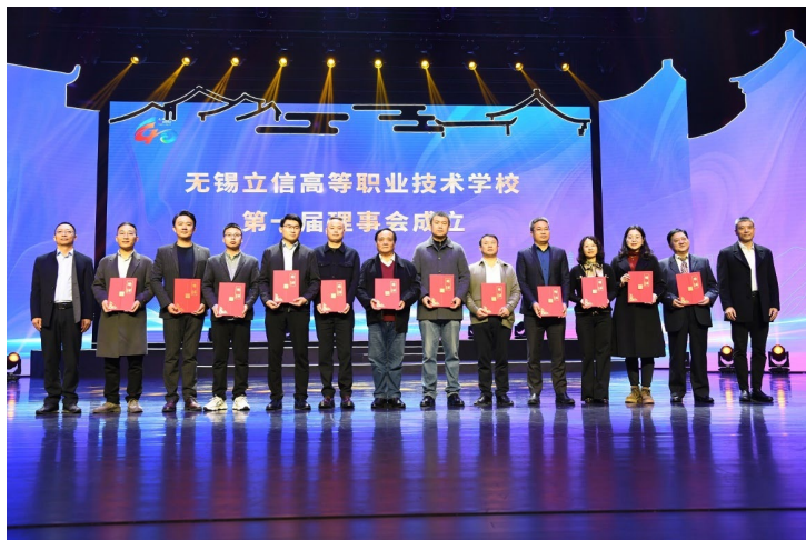
图 32. 学校第一届理事会成立

现治理数智化。学校大力建设智慧校园，逐步形成以数据为基础的学校信息化治理能力，打造集协同办公、教学管理、科研服务、学生管理于一体的“综合服务管理系统”。