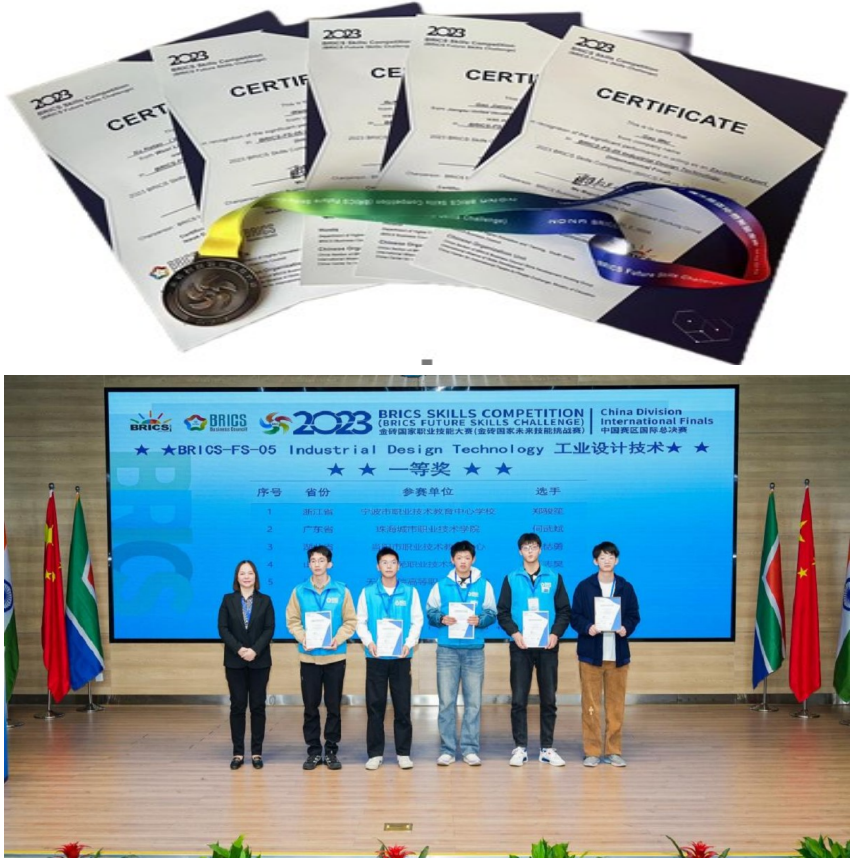
图 16. 学校获一等奖

校被授予国际优胜奖牌。金砖国家职业技能大赛是习近平主席在金砖国家领导人第十四次会晤重要讲话中指出的重点活动。旨在提升五国职业院校师生在创新、协调、组织、合作等方面的能力，培养金砖国家国际化高质量技术技能人才与人文交流人才。本次获奖是我院提升国际化办学交流合作的又一标杆性成果，也是学校坚持“岗课赛证”综合育人的靓丽成绩。学校将继续利用金砖国家职业技能大赛搭建的国际交流平台等进一步增进技能交流、提升竞技水平、拓宽国际视野。