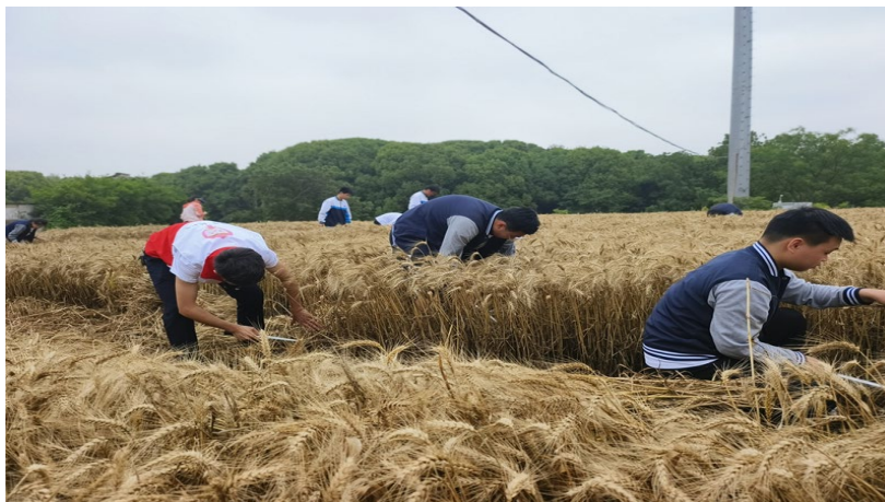
图 3. 学校学生参与社区劳动

动中，学生在社区志愿者的带领下学会了如何使用镰刀以及割麦子的基本方法。同学们一边割着麦子，一遍感受着大自然丰收的喜悦，每个人脸上都洋溢着幸福的笑容。大家分工协作，很快就将整片麦田的小麦收割完成，最后女同学们还细心地做起来“拾麦穗的小姑娘”。经过这次实践活动，同学们不仅在劳动中体验辛苦与快乐，而且也增强了团队合作能力，认识到粮食的来之不易，在每位同学的学习生涯中，添上了美好而又难忘的一课。