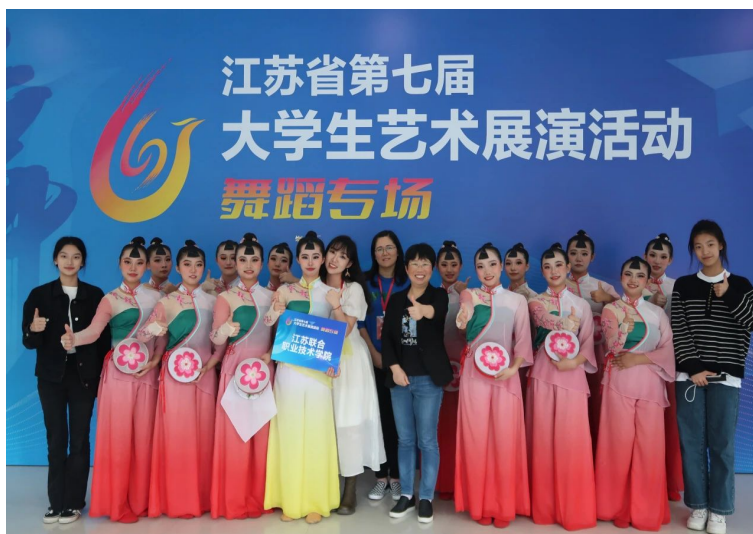
图 26. 学校舞蹈《绣影叠香》参加江苏省第七届大学生艺术展演

践教育各环节，落实德智体美劳五育并举，推进高雅艺术进校园、大国工匠进校园、非遗作品进校园。全面推进书香校园建设，以优秀传统文化为引领，以“书香育人”为价值导向，以“校园文化”活动为依托，充分利用“阅读”这一隐性教育资源来引导学生追求理想信念，让学生在阅读中获得成长。实施中华经典诵读工程，构建特色晨读，制定晨读实施方案，组织教师团队编写晨读课本，精心遴选了散文、美文、经典古文、经典诗词等，并录制领读音频，每学期末评比“晨读先进班级”和“晨读先进个人”。本年度有3位学生在江苏省“筑梦向未来”中华经典诵读大赛中荣获优秀奖，1位学生在无锡市中华经典诵读大赛中荣获二等奖。建成大学生文化艺术中心，以社团活动为载体，聘请非遗传承人为社团校外指导老师，培养学生在民族舞、太极、民乐、书法、竹刻、泥人、剪纸、刺绣等方面的兴趣爱好，弘扬传承中华优秀传统文化。本年度诵雅朗诵社和太极武术社两个学生社团均获得无锡市优秀学生社团荣誉称号，多个学生社团走进社区，积极参加社区组织的各项活动，为学校赢得社会声誉。学生社团的舞蹈作品《绣影叠香》和合唱作品《这世界那么多人》代表江苏联合职业技术学院参加江苏省第七届大学生艺术展演活动。