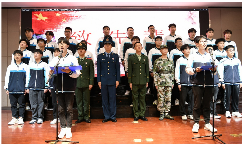
图 24. 学校“诵读红色经典 传唱红色歌曲”