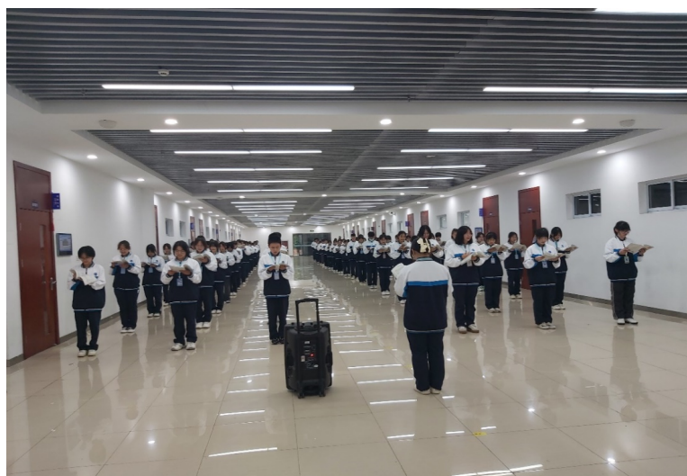
图 27. 学校学生集体晨读