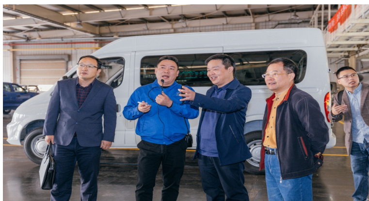
图 11. 学校领导到上汽大通汽车有限公司参观交流