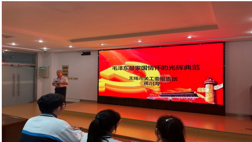
图 22. 学校邀请关工委讲师团成员来校宣讲革命先辈故事