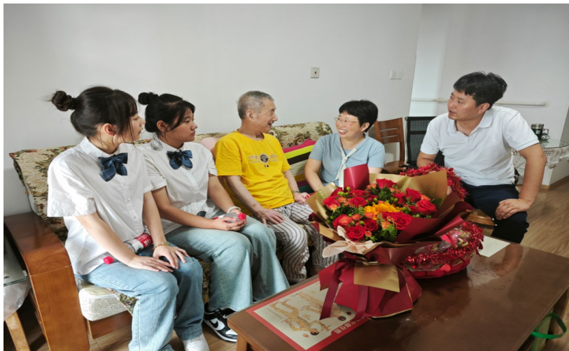
图 23. 学校师生代表慰问抗美援朝战争老英雄