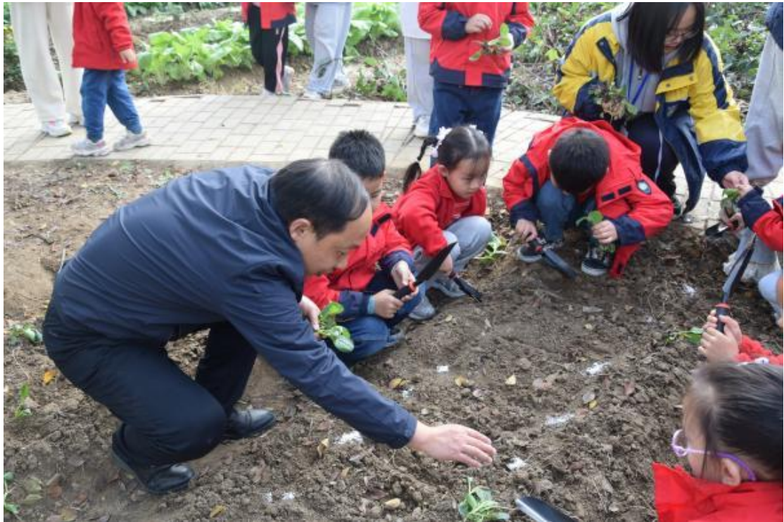
图 2 中小学生对职业体验活动

让体验者尊农重农、仰祖怀宗，文化自信。虽然人们对传统农耕文化的记忆和内涵正在淡化与模糊，但由此延伸的节奏和智慧充满着一种自然的审美，农耕文化的熏陶试图唤起中小学生对这种由古到今延续的智慧。同时，农耕文化室通过农耕文化的宣传片不断的让体验者回归田野，崇尚自然，感恩耕作，喜庆丰收，享受精神的陶冶。