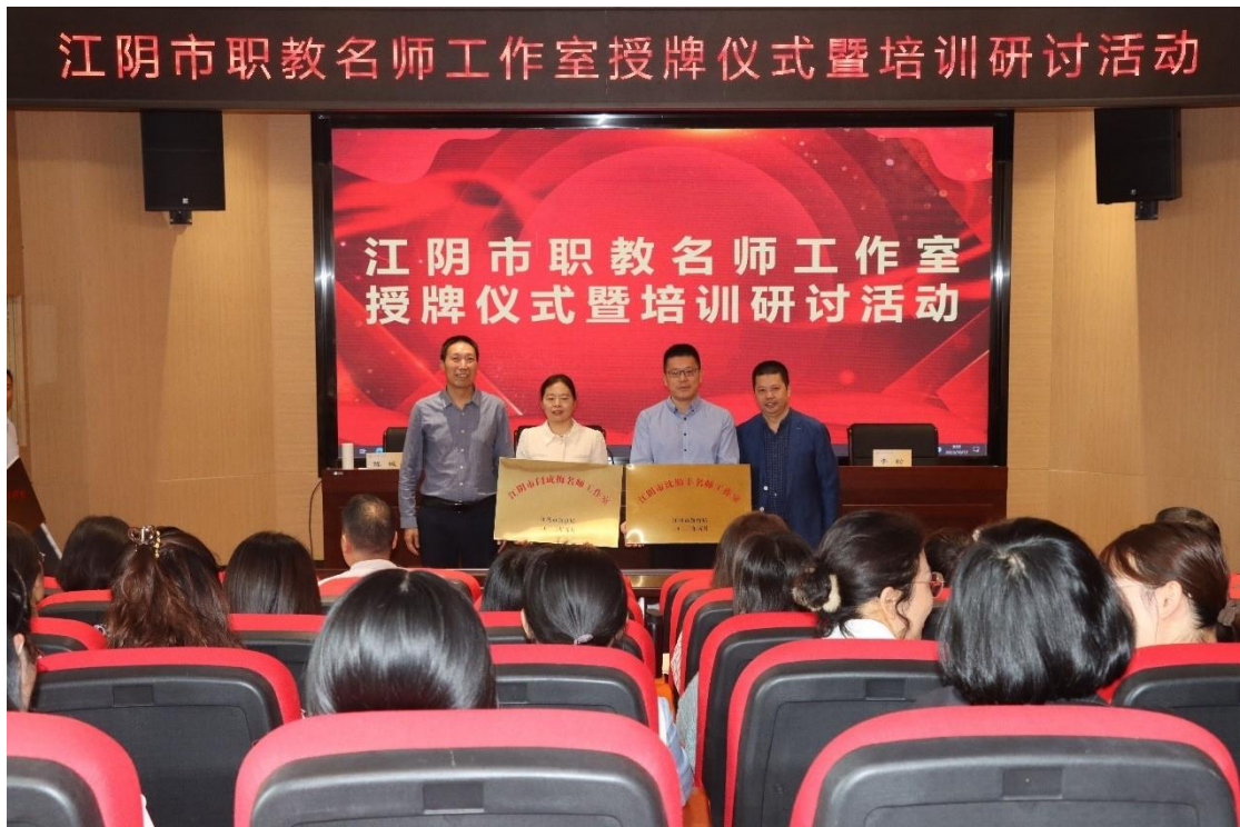
图 5 名师工作室授牌仪式