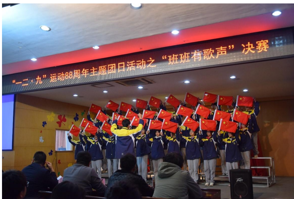
图 4 红歌嘹亮班班有歌声活动

为了让燎原之火熊熊不息，让红色基因融入血脉，让红色精神绽放光芒、激发力量，2023年华姿中专校团委立足专业特色，结合人才培养目标，创新思路，创造性构建了红色诗歌讲演团，红色故事宣讲团，红色经典赏析团等多个红色社团，把弘扬革命精神融入当代中专生精神文明建设和思想政治教育之中，融入校园文化建设之中，融入专业文化知识学习之中。红色经典赏析团组织学生观看影视剧和纪录片。红色诗歌讲演团通过诗歌朗诵赏析、红色歌曲传唱等方式，深入了解革命历史人物的感人事迹。学校还以各个节日为契机，鼓励并支持各个社团走出校园，走访红色宣教基地，比如清明时节徒步青阳烈士陵园等。