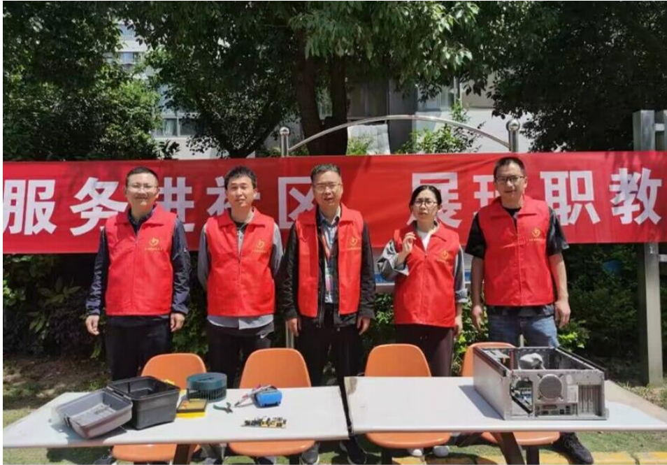
图3 “技能高手”开展志愿者服务

社团，创客社团，无人机社团，手工社团，空调维修社团的作品和成果展示，让周围同学们看到，听到，感受到能工巧匠就在身边。