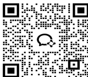
“书香无锡·畅享阅读”竞赛初中服务群