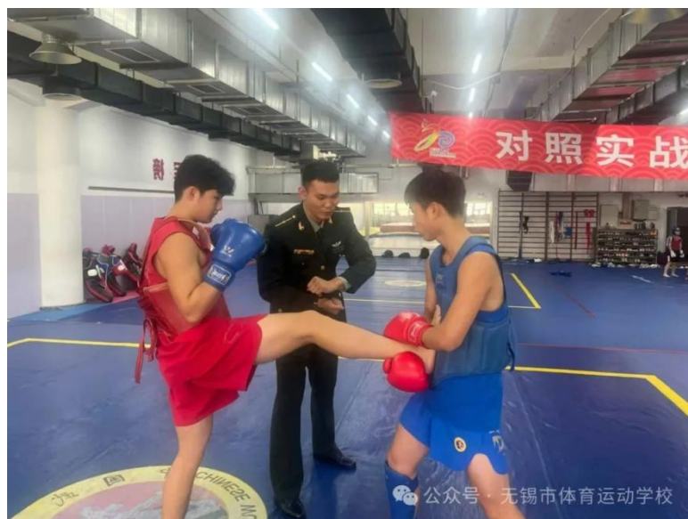
图 5-2 匠心筑梦·强国有我一市体校开展“大国工匠进校园”活动