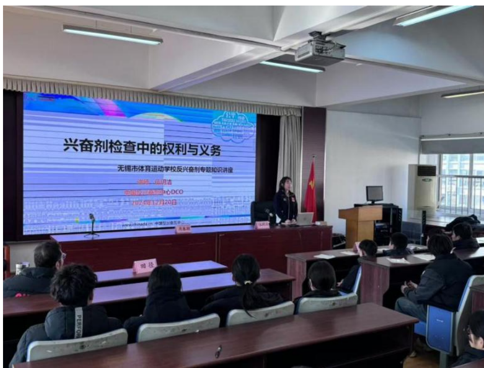
图 3-15 反兴奋剂讲座及知识竞赛