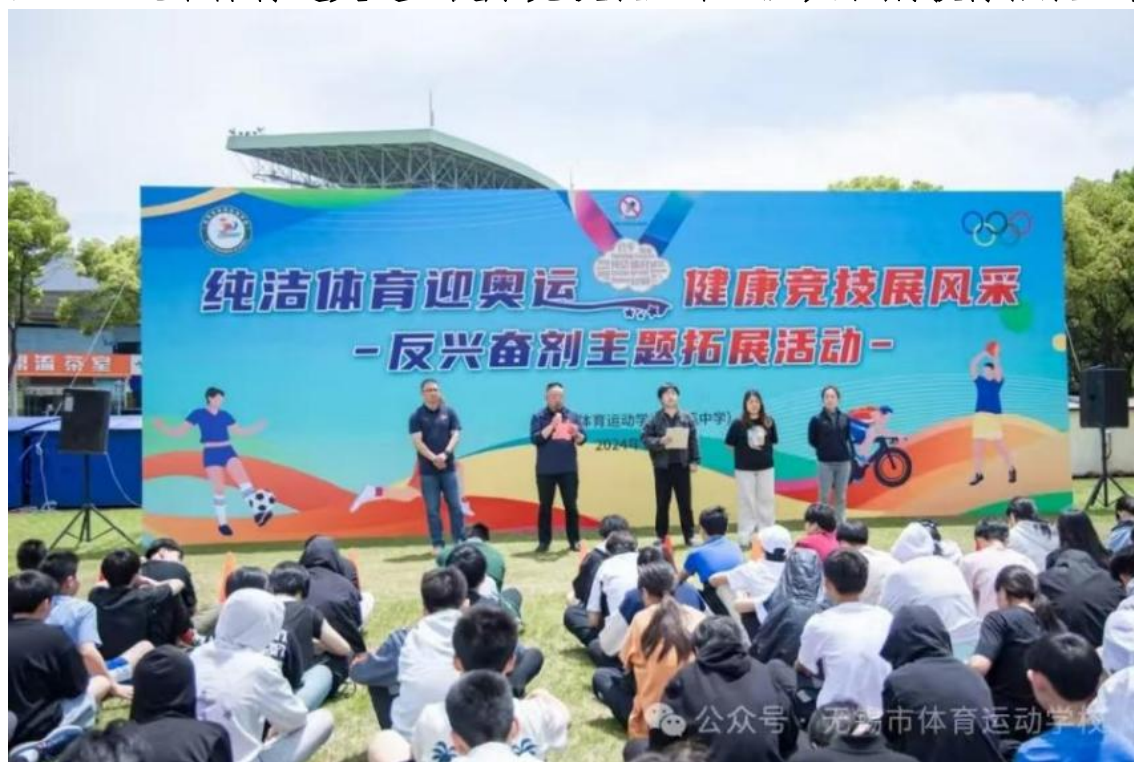
图 3-8 “纯洁体育迎奥运，健康竞技展风采”反兴奋剂教育拓展活动

“对兴奋剂说‘不’”的鲜明旗帜在风中飘扬，动感的音乐伴随着运动员热烈的比拼。无锡市体育运动学校(梁溪中学)开展“纯洁体育迎奥运，健康竞技展风采”主题反兴奋剂教育拓展活动，全校师生喊出反对兴奋剂的响亮口号。