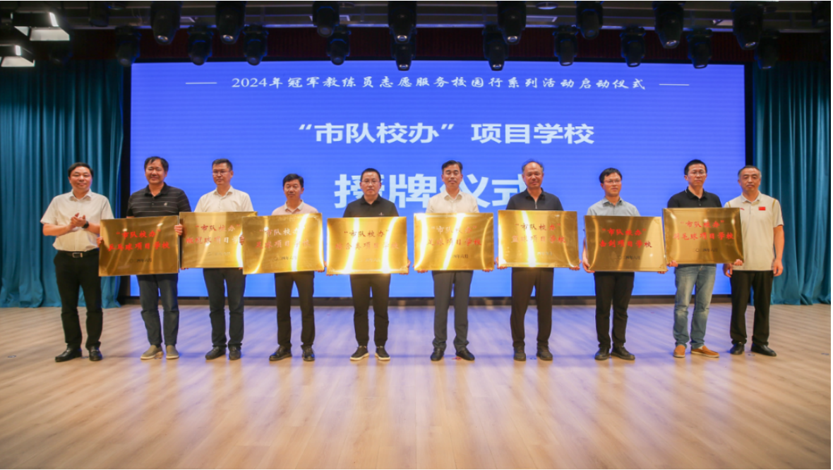
图 3-20 市队校办项目揭牌