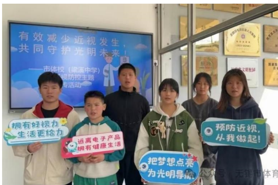
图 3-14 “有效减少近视发生，共同守护光明未来” 近视防控宣传活动