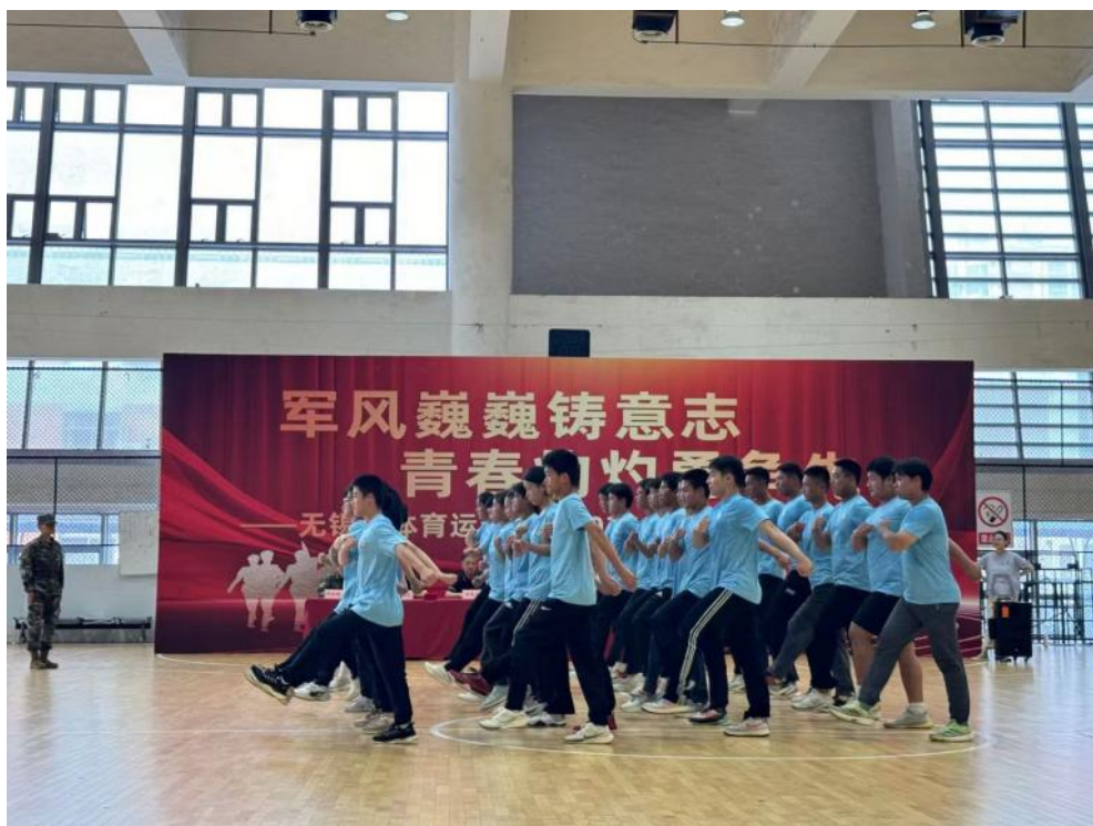
图 3-11 “军风巍巍筑意志、青春灼灼勇争先” 国防教育实践活动