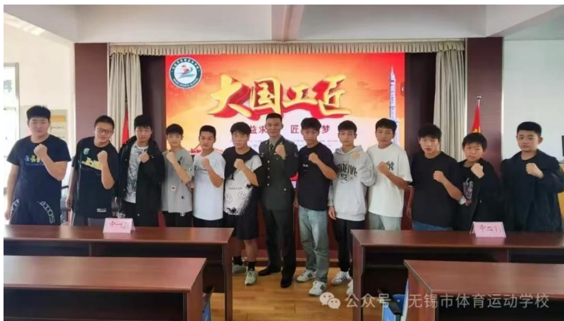
图 3-13 “匠心筑梦·强国有我” 大国工匠进校园活动