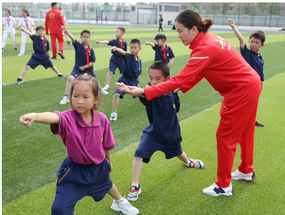
图 4-1 教练员进校园 1

好、带队经验丰富、组赛能力突出的优质教练资源送进校园，进一步满足学生多元化体育需求，促进青少年健康成长。