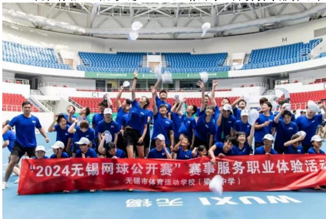
图 3-7 “跃动青春·网聚梦想”2024 无锡网球公开赛赛事服务活动

在 2024 无锡网球公开赛中，有这样一抹身影，他们头戴白色鸭舌帽，身穿统一的蓝色制服，“潜伏”在球场的角落，在中网和底线之间来回穿梭，他们，可不是简单的“背景板”，而是比赛场上不可或缺的角色，球童。捡球、传球、服务球员……他们还会帮助拿取裁判需要的必要物品，并在比赛时保持场地整洁，默默地站在场地角落的他们，是比赛的守护者。