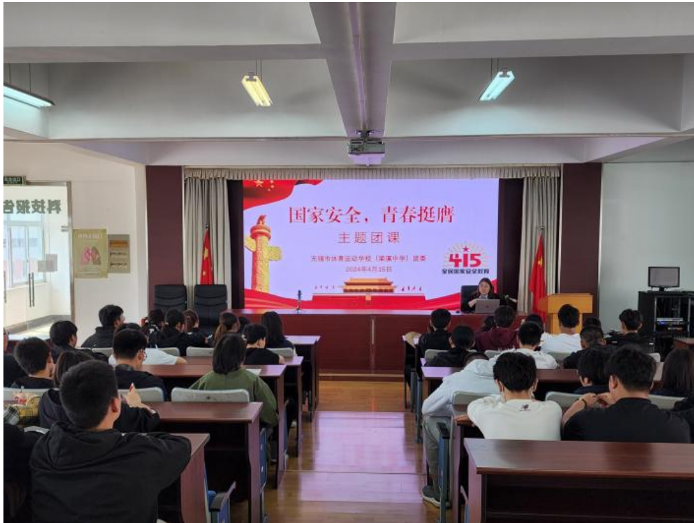
图 3-10 “国家安全·青春挺膺”主题团日活动