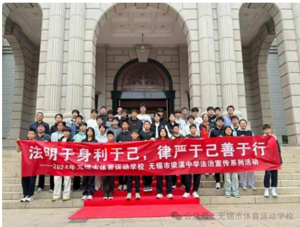
图 3-5 “法明于身利于己·律严于己善于行”法治宣传系列活动

为引导青少年树立法治观念，增强青少年尊法、学法、守法、用法的意识，护航青少年健康成长，无锡市体育运动学校（无锡市梁溪中学）组织学生走进无锡市中级人民法院，开展零距离法治教育，参与无锡市中级人民法院“法院开放日”体验活动。