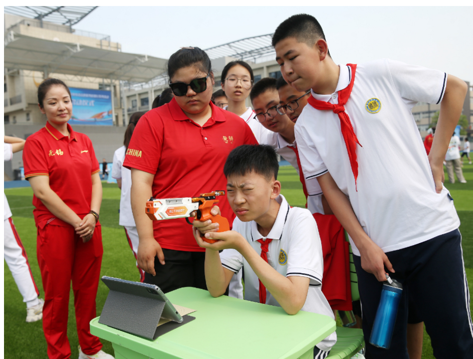
图 4-2 教练员进校园 2