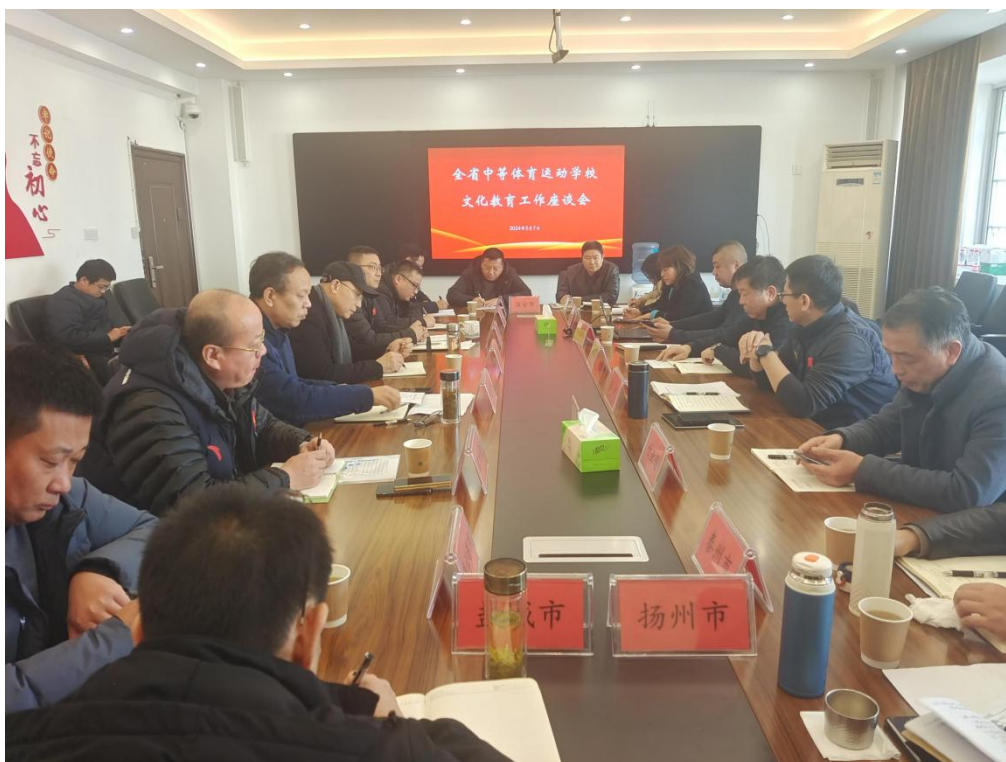
图 4-4 全省中等体育运动学校文化教育工作座谈会在锡召开