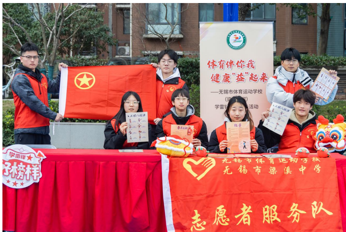
图 4-3 体育伴你我，健康“益”起来——学雷锋志愿服务系列活动

中，立足自身特色、贴近群众需求，从力所能及的小事做起，用行动传递真情，用奉献书写大爱，用双手传播时代正能量。