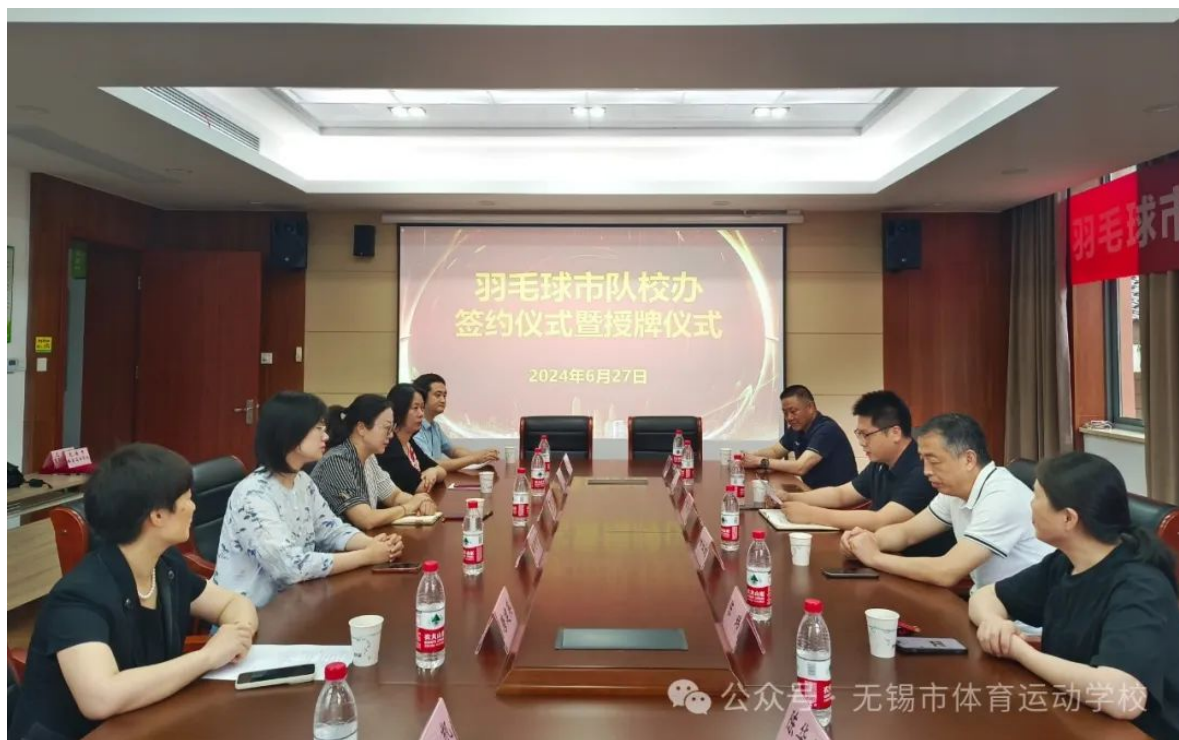
图 1-3 羽毛球市队校办签约暨授牌仪式

市队校办合作协议，并开展滨湖区体教融合工作推进会，同步就自行车项目与华东师大附属滨湖学校、篮球项目与育红小学的市队校办合作达成意向。