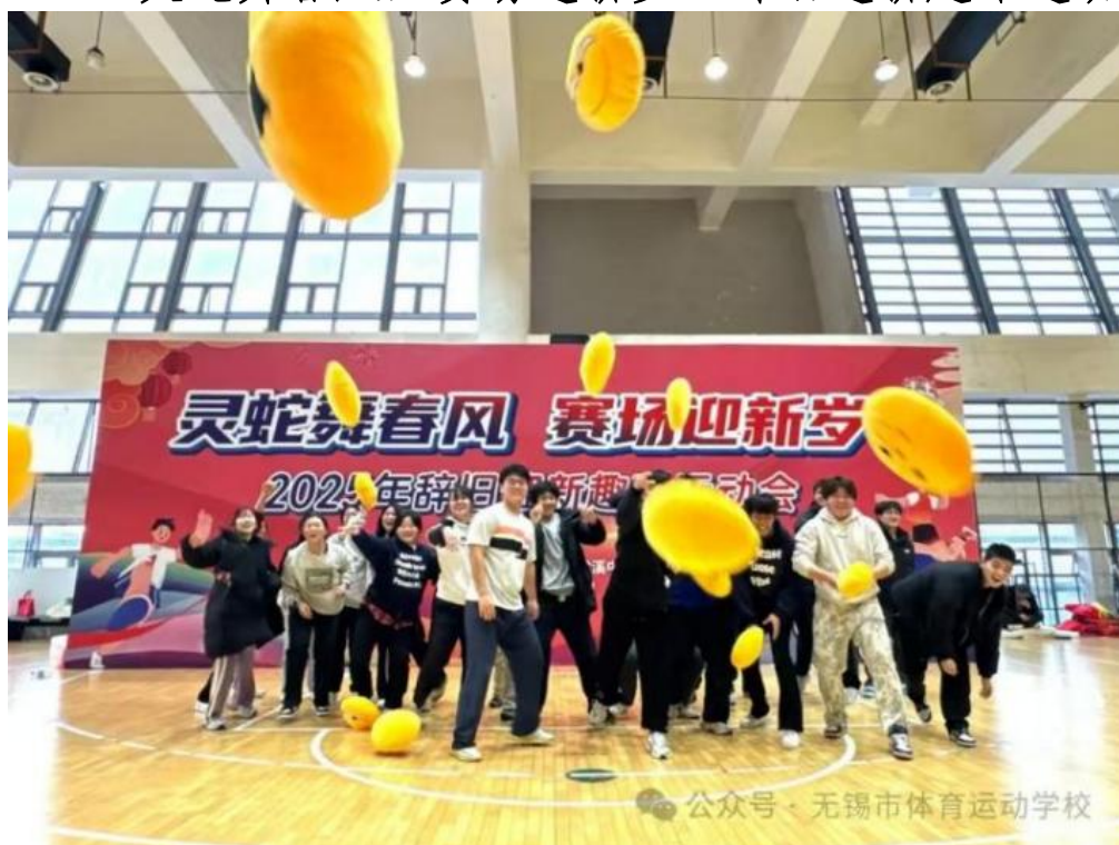
图 3-6 “灵蛇舞春风，赛场迎新岁”辞旧迎新趣味运动会

冬至阳生，岁回律转。2025 新年来临之际，同学们、老师们、教练员们又一次欢聚在一起，举办这场妙趣横生的运动会。