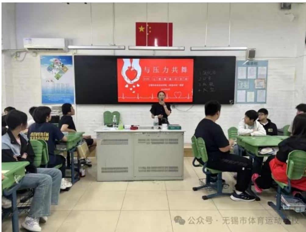
图 3-2 “与压力共舞”OH 卡心理辅导活动

5•25 心理健康日正值临近中考，为帮助初三学生化解毕业和升学的焦虑，我校组织了一场特殊的解压活动——“与压力共舞”OH 卡心理团体辅导。简单介绍了 OH 卡的游戏规则和内涵之后，同学们分成了多个小组，在老师的指引下每个人随机抽取卡片，形容在看到卡片的第一想法，并联系自身进行联想。同学们从打乱的图卡里抽取卡牌，依次进行描述，大家畅所欲言，积极思考，分享各自的理解和想法，互相交流，拉近了彼此之间的距离。整场活动下来，同学们收获了别样的感受与启发，为心灵做了一次“大扫除”，面对即将到来的人生转折轻松上阵。“5•25”谐音“我爱我”，祝福每一位同学学会关爱自我，了解自我，接纳自我，关注