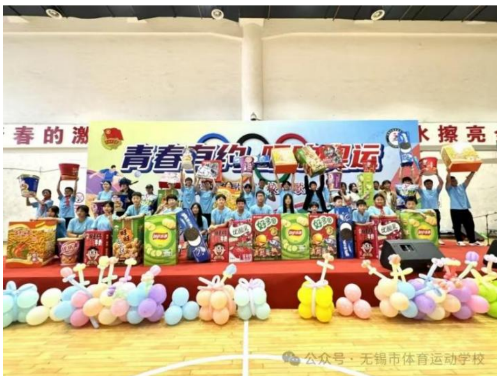
图 3-1 “青春有约，唱响奥运”班班有歌声校园歌会活动

【案例 3-1】当艺术遇上反兴奋剂教育——“青春有约，唱响奥运”市体校(梁溪中学)“班班有歌声”校园歌会活动