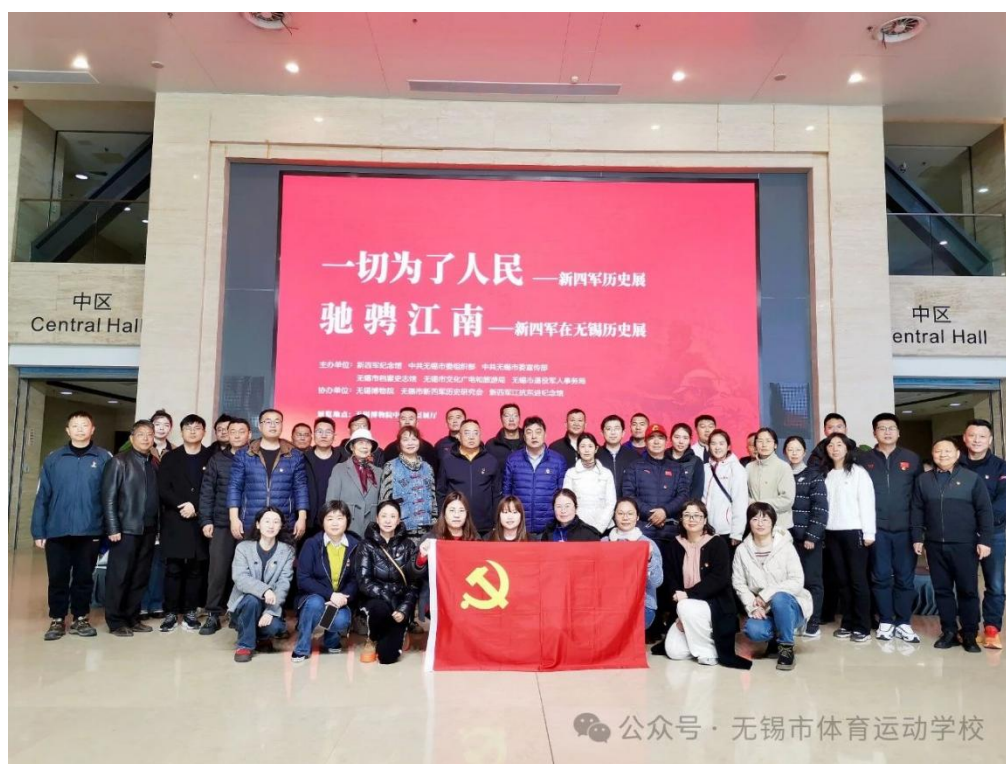
图 5-1 市体校党员干部赴无锡博物院开展现场学习

大家一致认为，这次实境教学感受很深、收获很大，在追寻红色革命足迹中，真切感受到中国共产党在人民的支持下，进行艰苦卓绝的革命斗争，为夺取抗日战争和解放战争胜利做出了巨大牺牲和重大贡献。大家纷纷表示，新时代新阶段，要向革命前辈学习，自觉传承红色基因，始终牢记初心使命，立足本职岗位不断开拓创新、奋发有为，为体育、教育事业的高质量发展贡献力量。