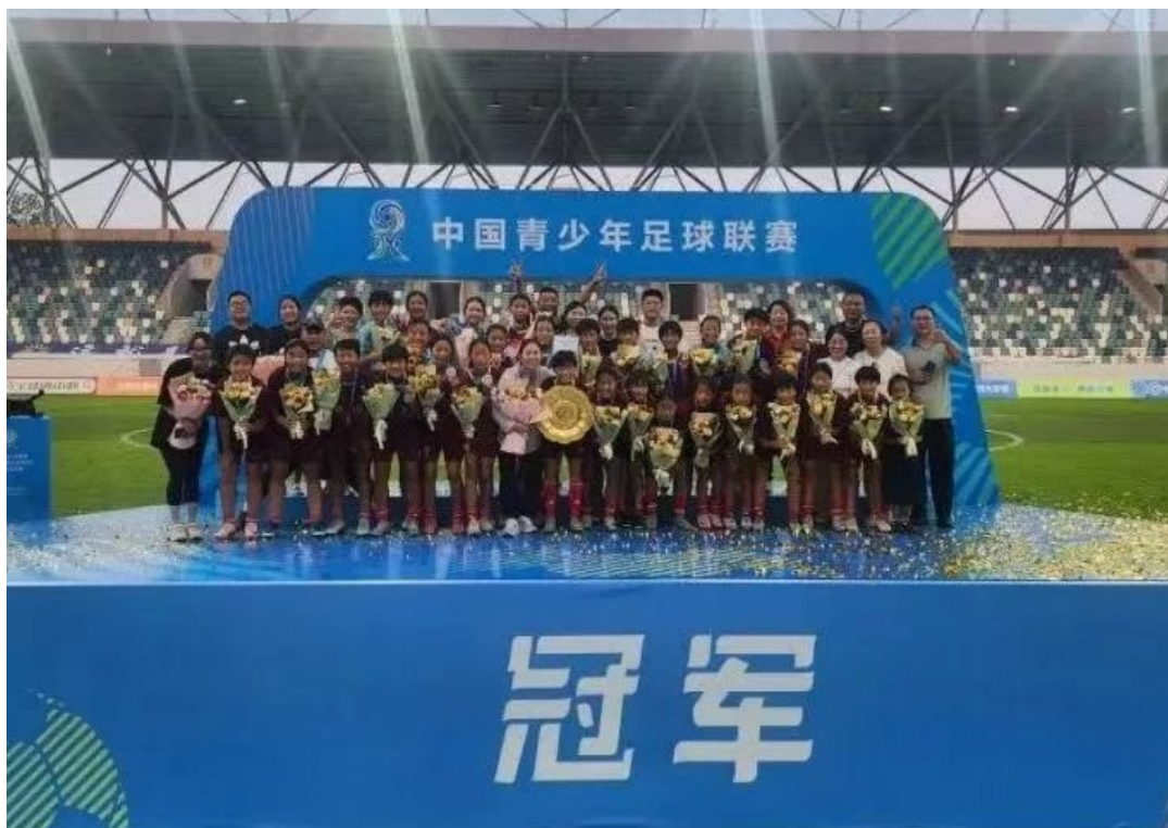
图 2-1 广丰女子足球队获第三届中国青少年足球联赛（女子 U14 组）冠军