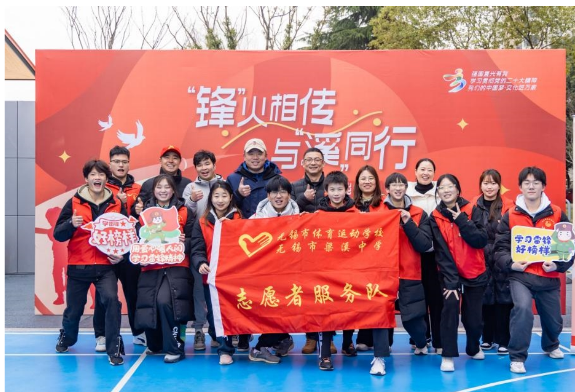
图 3-9 “体育伴你我，健康“益”起来”主题学雷锋志愿服务活动