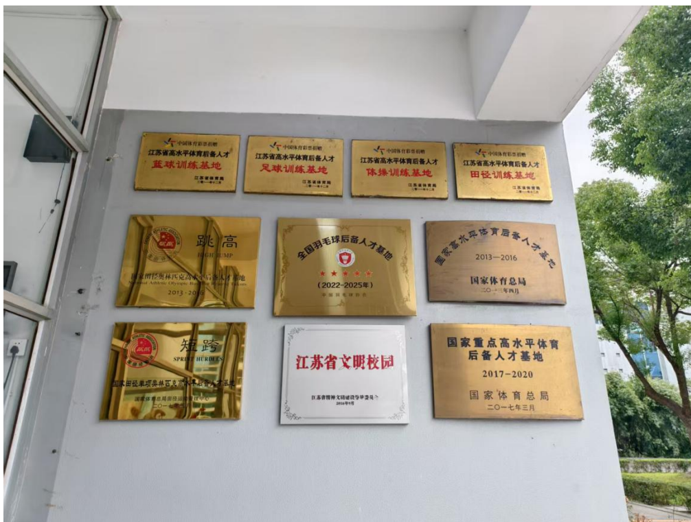
图 1-1 学校荣誉

学校紧紧围绕“立德树人、育才夺标”的办学方向和根本任务，坚持为国家培养优秀体育后备人才。2009年起至今，已连续3个奥运周期被国家体育总局认定为“国家高水平体育后备人才基地”，先后荣获“全国群众体育先进单位”、“江苏省群众体育先进单位”、“江苏省文明校园”、“2019-2021年度无锡市文明校园”等荣誉称号。