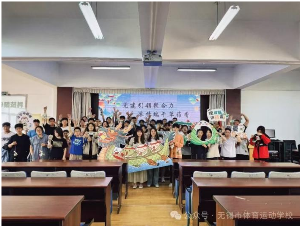
图 3-3 “党建引领聚合力·浓情端午草药香”我们的节日——