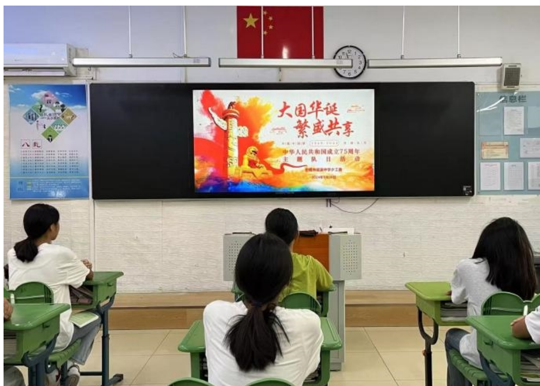
图 3-12 “大国华诞·繁盛共享” 我们的节日——国庆节主题实践活动