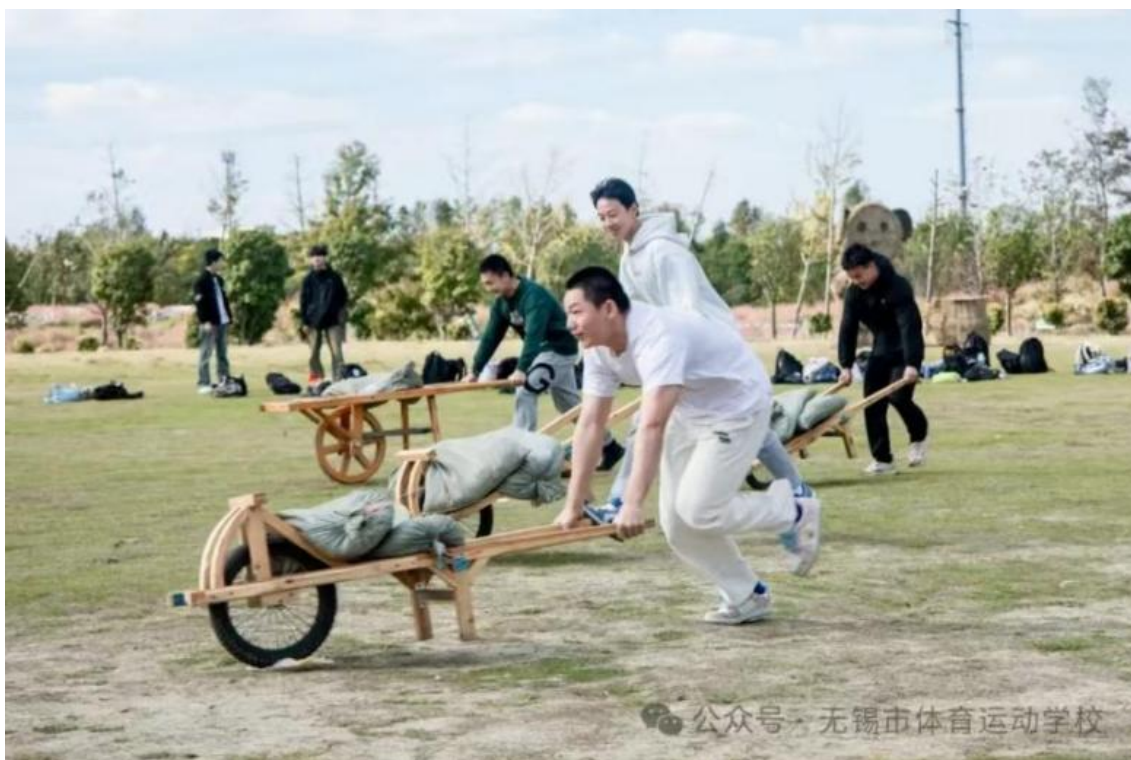
图 3-4 “田园诗情绘华章·乡村画意谱新篇” 秋季劳动实践活动

秋天的花星球菊花坚守颜色，就像在等待着今天，欢迎体校学子的来到。虽然花信有期，但是同学们的热情永无期限；不在赏花的最好季节，却是成长的最佳时间。