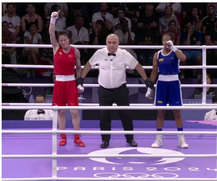
图 1-2 拳击运动员许紫巴黎奥运会挺进八强

2024 年，我校培养输送的拳击运动员许紫春、柔道运动员蔡琪、篮球运动员罗欣棫、金维娜、射击运动员顾生辰、胥若霖、射箭运动员王梓丞、跳水运动员王飞龙、乒乓球运动员石洵瑶、孙闻、羽毛球运动员丁柯蕴、鲍骊婧在国家队为国征战，其中，许紫春在 2024 年巴黎奥运会上获得女子 57 公斤级拳击第五名。