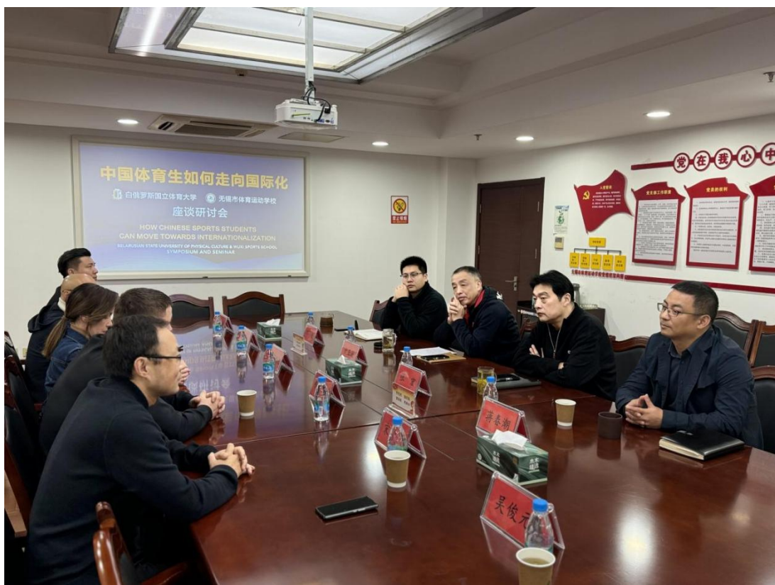
图 6-1 白俄罗斯国立体育大学校长一行赴我校参观座谈